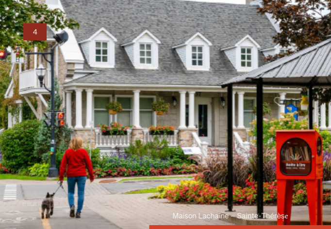
Maison Lachaine – Sainte-Thérèse