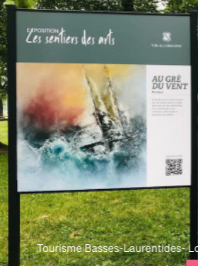
Tourisme Basses-Laurentides- Lorraine.