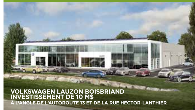
VOLKSWAGEN LAUZON BOISBRIAND INVESTISSEMENT DE 10 M$ À L'ANGLE DE L'AUTOROUTE 13 ET DE LA RUE HECTOR-LANTHIER

La nouvelle taxation 2020 a été établie en fonction de cette nouvelle donnée, afin d'en limiter les impacts sur le portefeuille des citoyens.